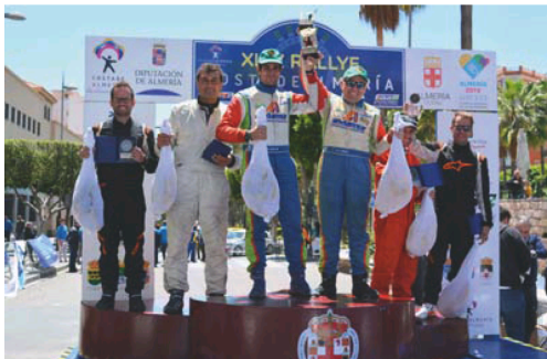
Pódium de campeones de esta 44ª edición del Rallye Costa de Almería.