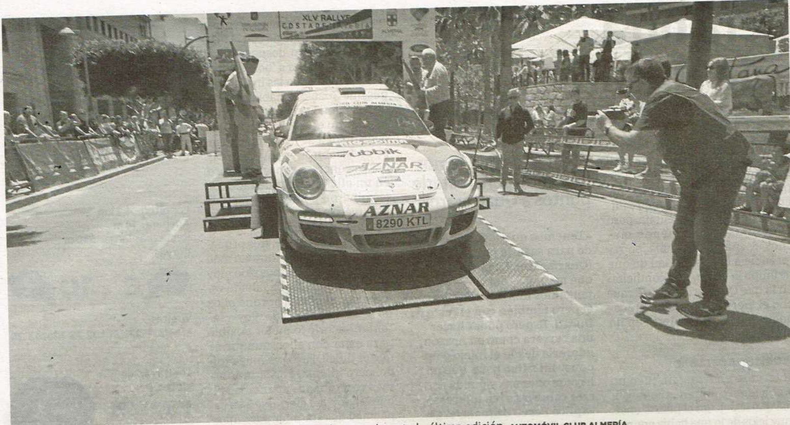
José Antonio Aznar, en la llegada de la rambla Federico García Lorca durante la última edición.